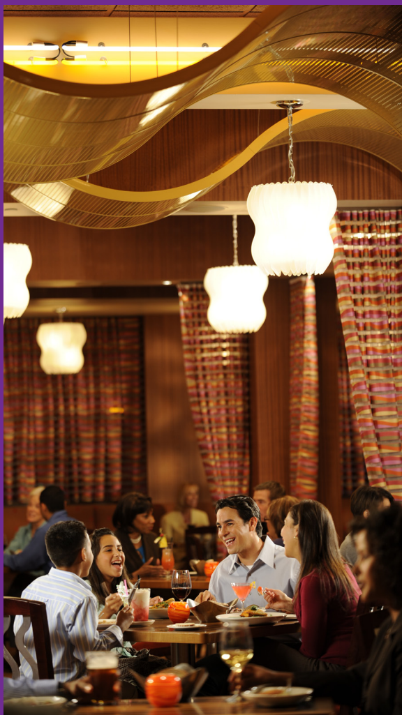
The Wave no Disney's Contemporary Resort